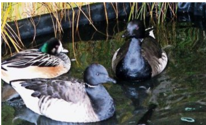
Etwa 400 Tiere werden präsentiert.

Rund 400 Tiere werden präsentiert. Darunter sind Puten, Gänse, Enten, Hühner, Zwerghühner und Tauben. Ein besonderer Hingucker ist das Ziergeflügel wie Goldfasane, Rothalsgänse, Witwenpfeifgänse, Brautenten, Chile-Pfeifenten und Moorenten, die in den herbstlich hergerichteten, naturgetreuen Volieren zu bestaunen sind. Geöffnet ist die Schau am