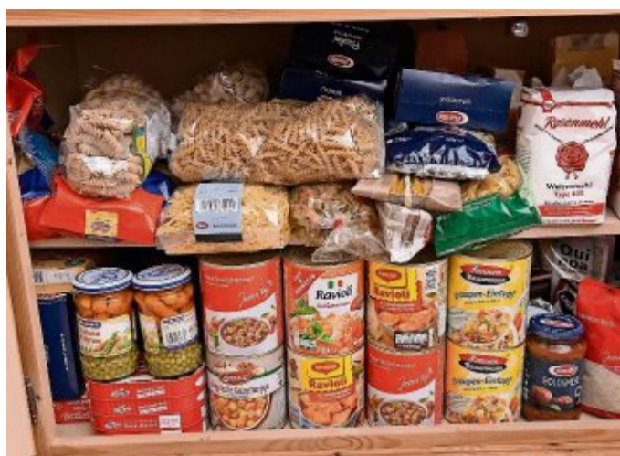
Solche Lebensmittel, die ohne Kühlung haltbar sind, stehen ebenso für den „Umgekehrten Adventskalender“ hoch im Kurs wie Hygieneartikel. Teilnehmer der Tafel-Aktion können sie einfach vom 1. bis 24. Dezember in einen Karton packen und am 28. Dezember abgeben.

Mit dem Advent naht eine besondere Zeit im Jahr. Viele öffnen ihre Adventskalendertüren und freuen sich auf ein großes Fest. „Wir möchten mit einer etwas anderen Version des Adventskalenders Weihnachtsstimmung verbreiten und dabei Menschen unterstützen, die-