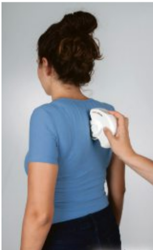
„Mit der Spinalmouse wird die Wirbelsäule strahlungsfrei dargestellt.“

Sanitätshaus INCORT in Bremer-vörde, Rathausmarkt 2, um den Ursachen IHRER Rückenschmerzen auf den Grund zu gehen. Der erste Schritt ist eine genaue Vermessung der Wirbelsäule mit der SpinalMouse®. Dieses computergestützte Messsystem bestimmt die Beweglichkeit und Stellung der einzelnen Wirbelsegmente. Sie tastet die Wirbelsäule strahlungsfrei ab und liefert schnell eine zuverlässige Darstellung der knöchernen Strukturen. Die Ergebnisse ermöglichen eine Analyse von möglichen Wirbelkörperfehlstellungen. Fehlstellungen haben Auswirkungen auf die gesamte Statik des Körpers, was Auslöser für Schmerzen im Rücken, den Füßen oder anderen Gelenken sein kann. Um Wartezeiten zu vermeiden, vereinbaren Sie bitte einen Termin unter der Telefonnummer 04141 41 19-0 oder per E-Mail an event-stade@incort.de . Wer gleich aktiv etwas für seine Gesundheit tun möchte, erhält am Aktionstag 15 % Rabatt auf Produkte wie Therabänder, das Blackroll-Sortiment u.v.m.