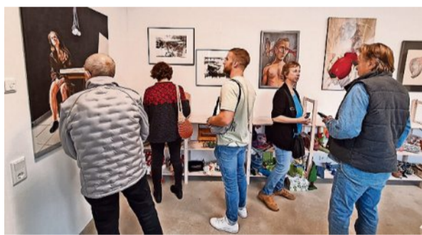
Die von der Jury ausgewählten Werke sind bis zum...