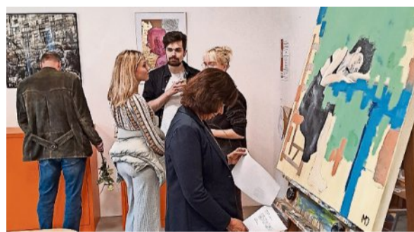
...25. November in Bremervörde ausgestellt.