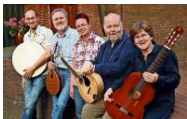
Friends in Music, 18. November, im BBG-Markt.