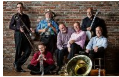
Die Jazz Lips, 15. November.

Ein Doppelkonzert gibt es am 25. November mit der Jazz-Rock- und Funk-Formation „Very Happy Feet“, die bereits 1984 im le-