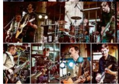
Doppelkonzert mit den Very Happy Feet (Foto oben) und Woodbridge Burning, 25. November.